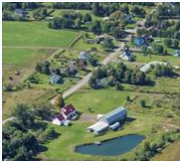
Ville de Lévis