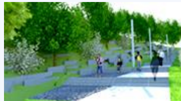
Ville de Lévis

Vous désirez savoir si votre projet est admissible ? Visitez-nous au Secrétariat à la Capitale-Nationale/soutien financier