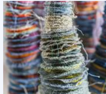
Biennale internationale du lin de Portneuf Crédit : Michelle Sirois-Silver

Cet événement mettant en lumière les pratiques contemporaines liées au lin a bénéficié de 35 k$. La BILP participe au développement culturel régional, dynamise le milieu artistique et valorise les lieux patrimoniaux de la région.