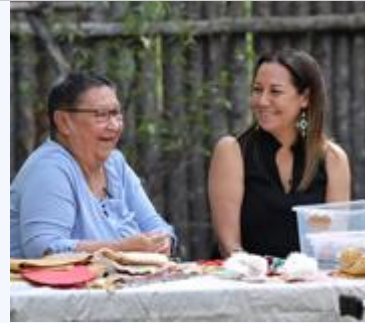
KWE! À la rencontre des peuples autochtones

L'événement vise à mettre de l'avant les onze nations autochtones présentes au Québec par des prestations artistiques et musicales, des ateliers sur les savoirs traditionnels, des expériences culinaires, des discussions sur les enjeux qui touchent les communautés autochtones et un carrefour culturel. 70 k$ ont été alloués à l'édition 2021.