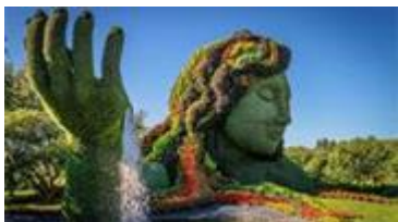
Mosaïcultures internationales Québec 2022