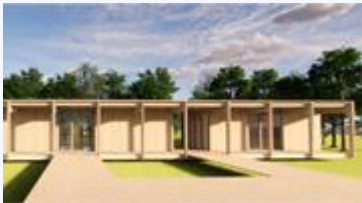
Ville de Baie-Saint-Paul

60 k$ ont été octroyés pour la promotion et l'aménagement des sites de cet événement se déroulant sur six jours. La région de Québec se démarque avec cette offre de produit unique qui propose des parcours exceptionnels en pleine nature combinés à un camp de base animé.